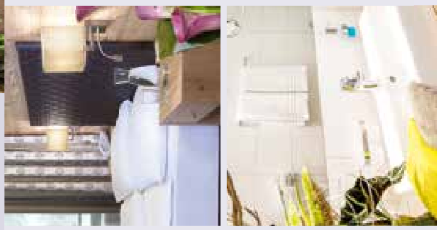
Anzeigen sowie Sitz- und Druckfehler vorbehalten.

Grafik & Layout: XTREMWERBEAGENTUR - Tel.: 0526/874740